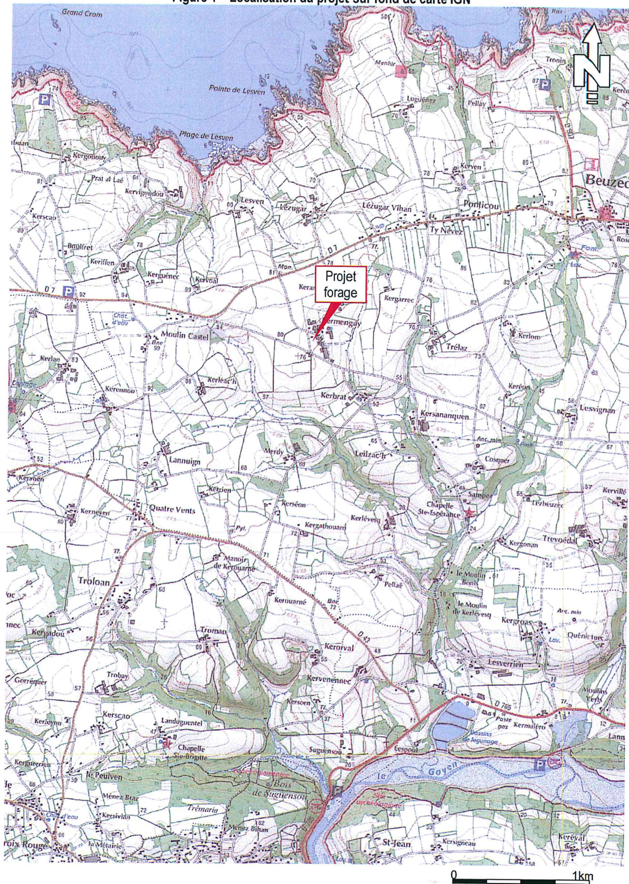
Figure 1 – Localisation du projet sur fond de carte IGN